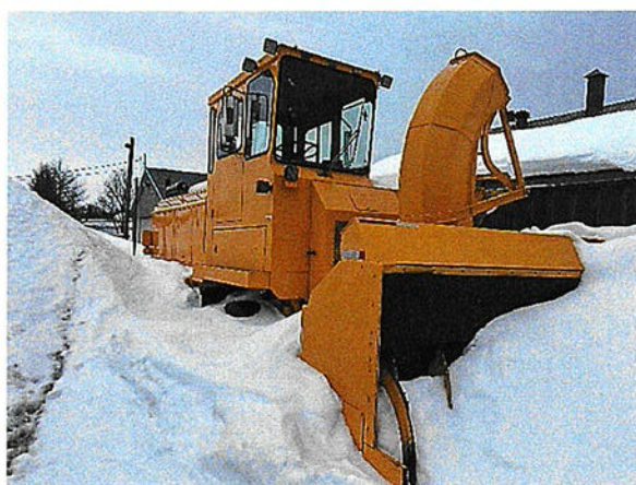
Souffleur Sicar Artis 1995

Il incombe aux acheteurs éventuels d'inspecter les véhicules mis en vente avant de présenter une offre quelconque. Les inspections doivent être planifiées auprès du responsable désigné, M. Francis Lepage (418-963-3529).