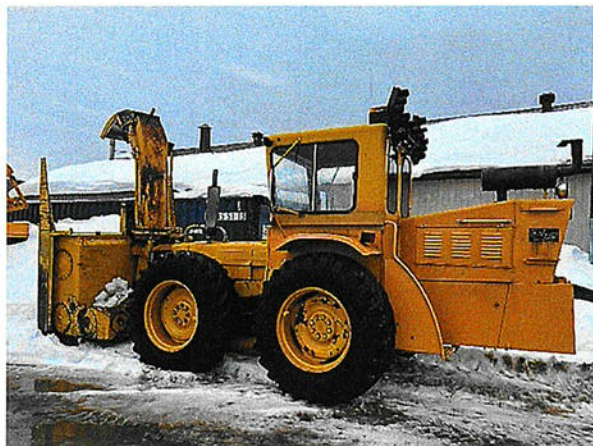
Souffleuse Vohl 1986