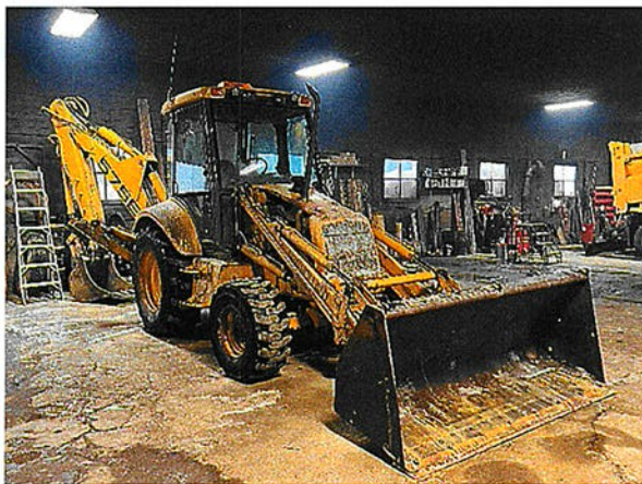
Rétrocaveuse New Holland 1998

La Municipalité de Saint-Jean-de-Dieu demande des soumissions relatives à la vente des véhicules usagés suivants: